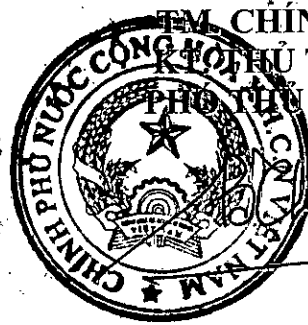
Bùi Thanh Sơn