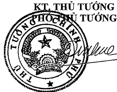
Vương Đình Huệ