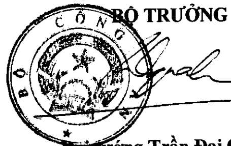
Đại tướng Trần Đại Quang