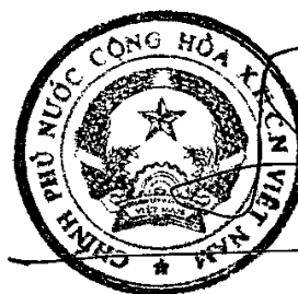
Nguyễn Tấn Dũng