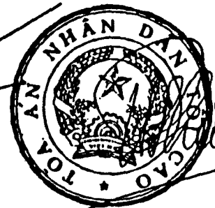
Đặng Quang Phương

KT. CHÁNH ÁN TÒA ÁN NHÂN DÂN TỐI CAO PHÓ CHÁNH ÁN THƯỜNG TRƯỞNG